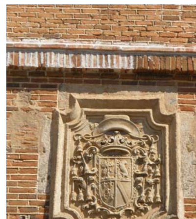
Escudo del palacio del obispo Manzano

El núcleo antiguo de Jaraíz de la Vera queda al norte de la carretera comarcal C-501 y todo él está muy alterado por las construcciones de nueva planta que se han realizado en los últimos años con motivo de la expansión del pueblo. Las plazas más interesantes son: la principal, donde se encuentra el edificio del Ayuntamiento, la de Ayala y la de la iglesia de Santa María. La primera es la Mayor, en ella se celebran mercados, tiene soportales y se ve una casa, con un hermoso escudo, (nº 7),