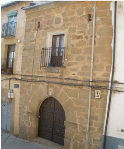
Casa nº7 de la pza. de la Crucera

El edificio del ayuntamiento es de especial interés pero está muy reformado.